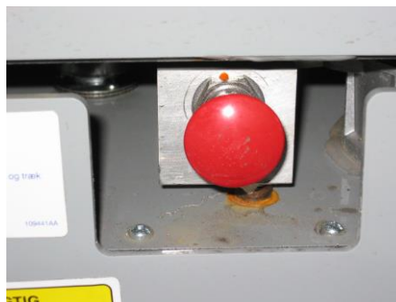
(b) Nødsænkings ventil på el-kabinet