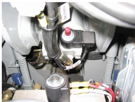
(a) Holdeventil med rød skrue.

15. Derefter hives ud i nødsænkings ventilens (b) røde knap indtil liften er sænket. Nødsænkings ventilen sidder på det elektriske kabinet på liftens base. For at genoptage normal operation af liften trykkes den røde skrue på holdeventilen ind og drejes med uret.